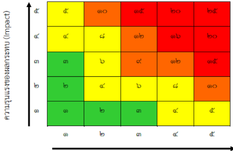
โอกาสที่จะเกิดความเสียหาย ( Likelihood )